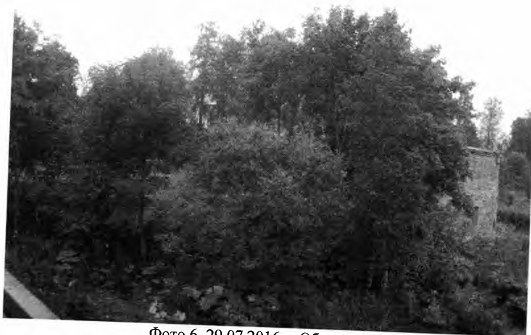
Фото 6. 29.07.2016 г. Общий вид