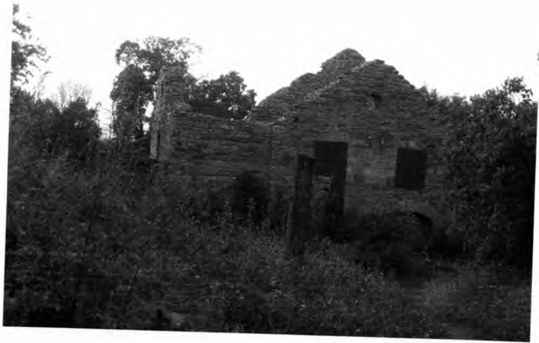
Фото 3. 29.07.2016 г. Мельница