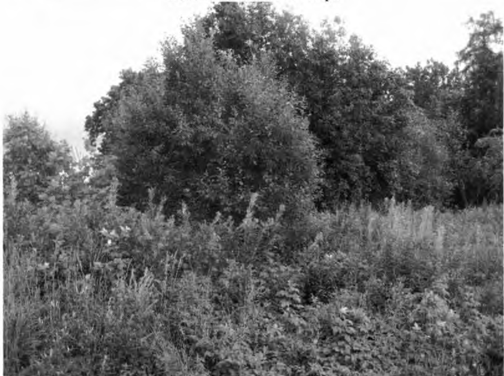
Фото 2. 29.07.2016 г. Каре усадебного дома, с флигелем и хоз. постройками (место)