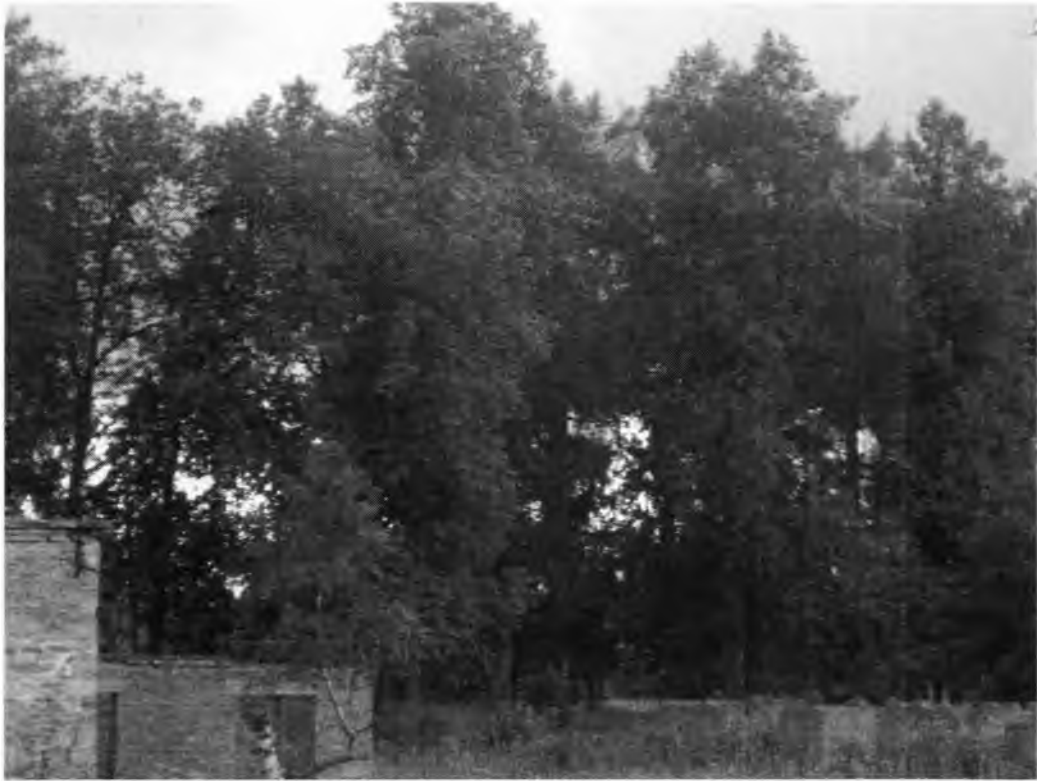
Фото 1. 29.07.2016 г. Парк