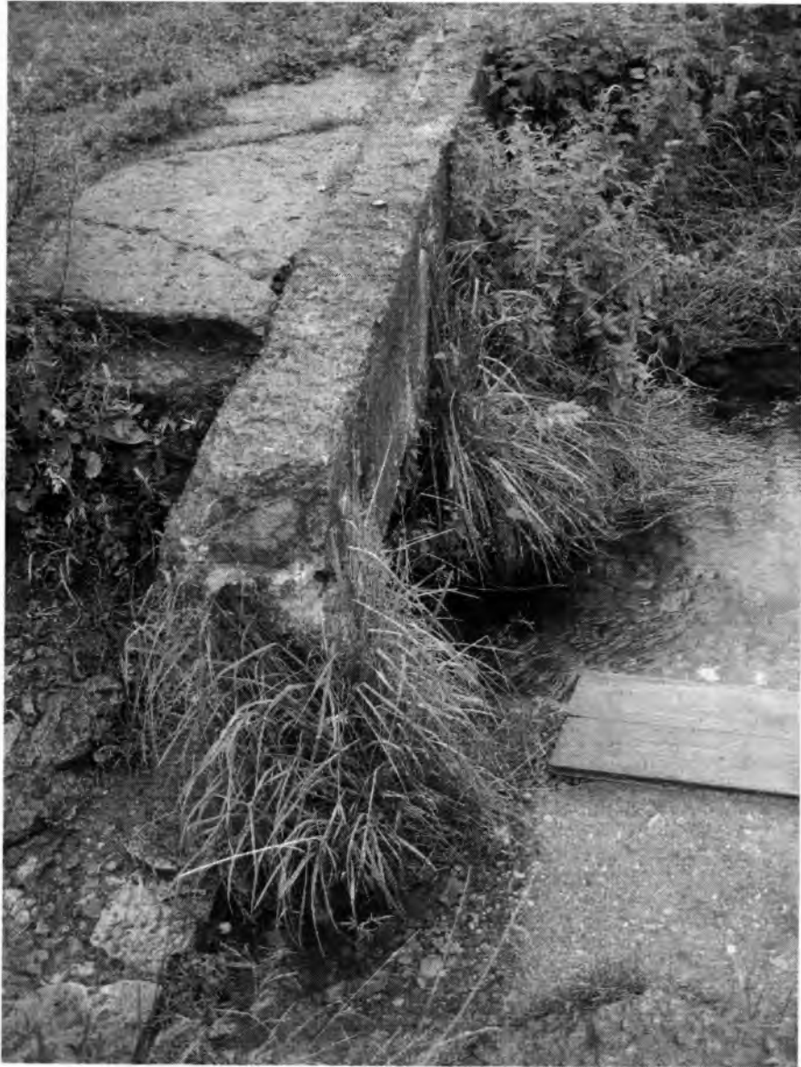
Фото 7. 29.07.2016 г. Родник в каменной кладке со спуском к воде