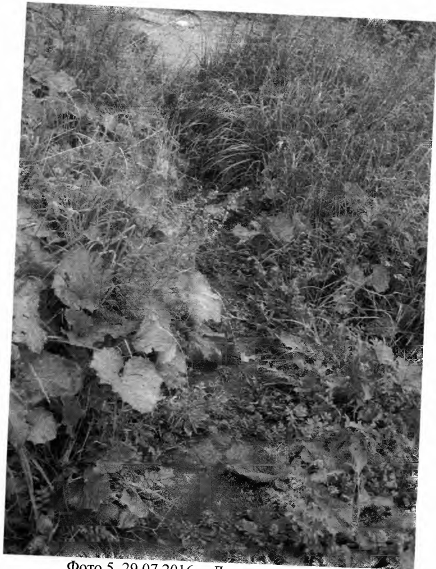
Фото 5. 29.07.2016 г. Лестница к роднику