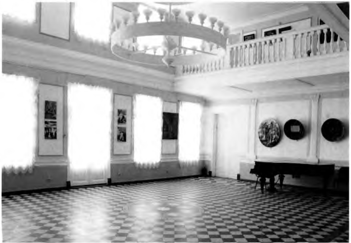
Фото 5. Интерьер