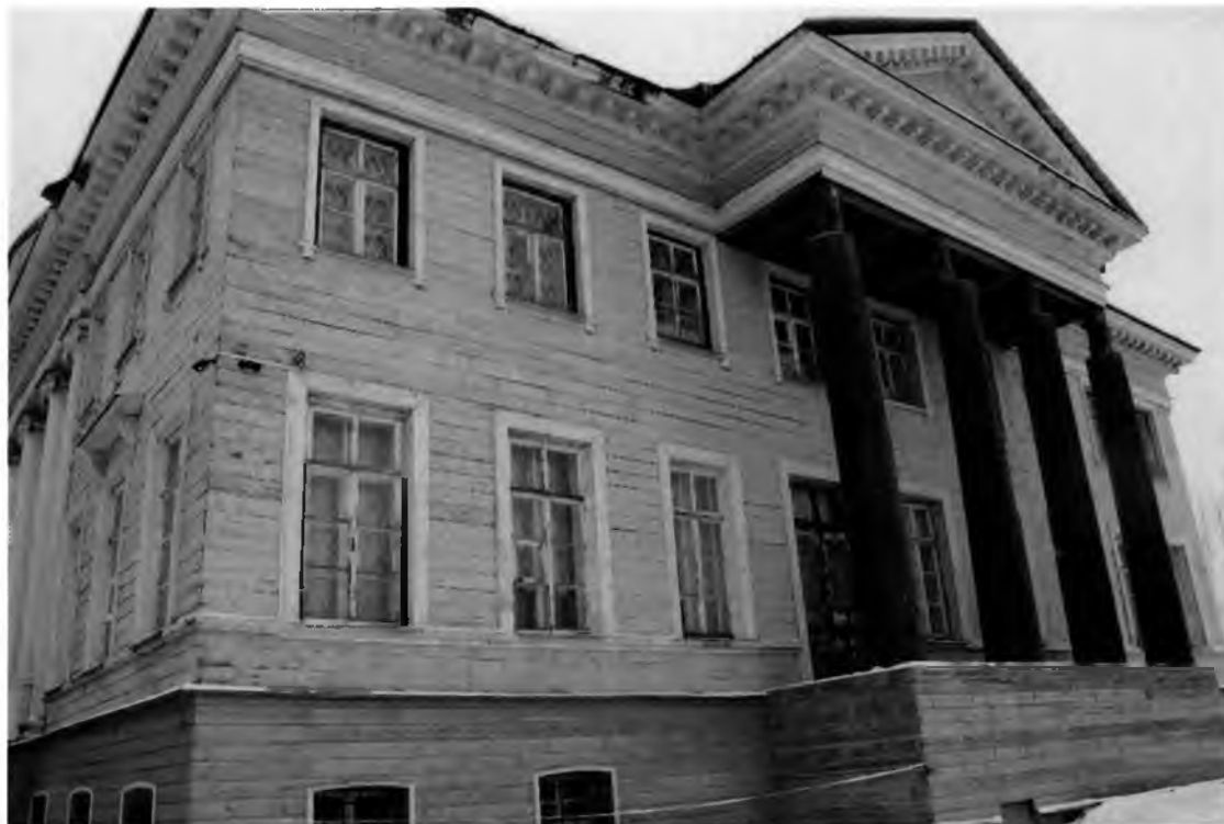
Фото 3. Северо-восточный фасад