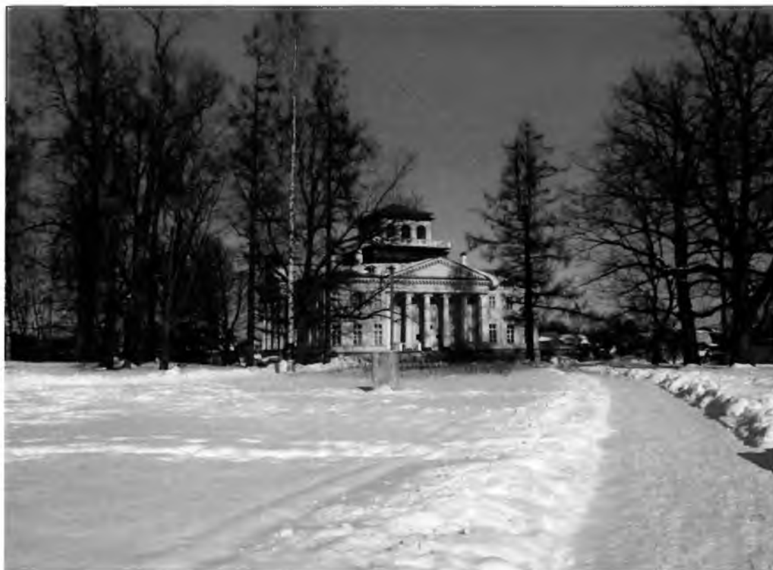
Фото 1. Общий вид