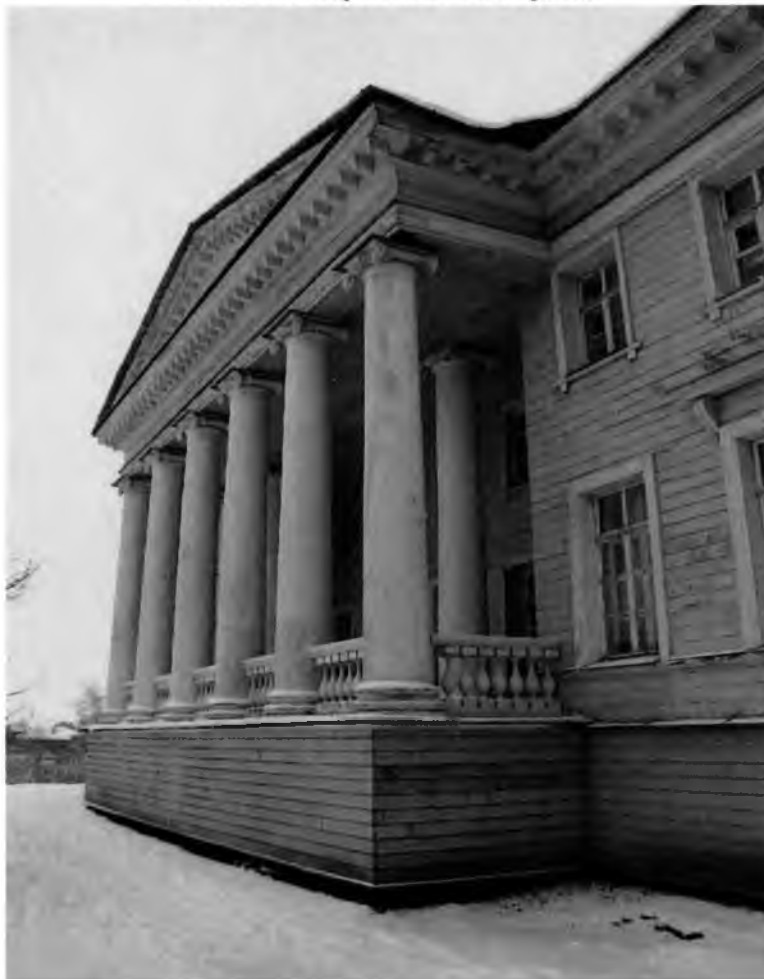
Фото 4. Северо-западный фасад