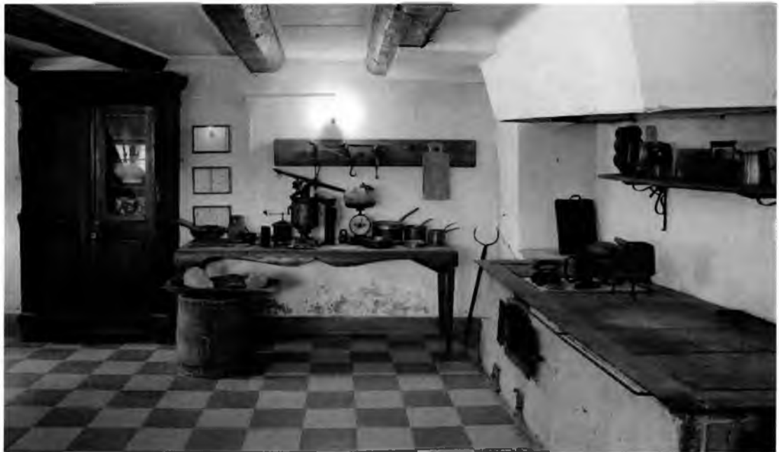
Фото 6. Интерьер