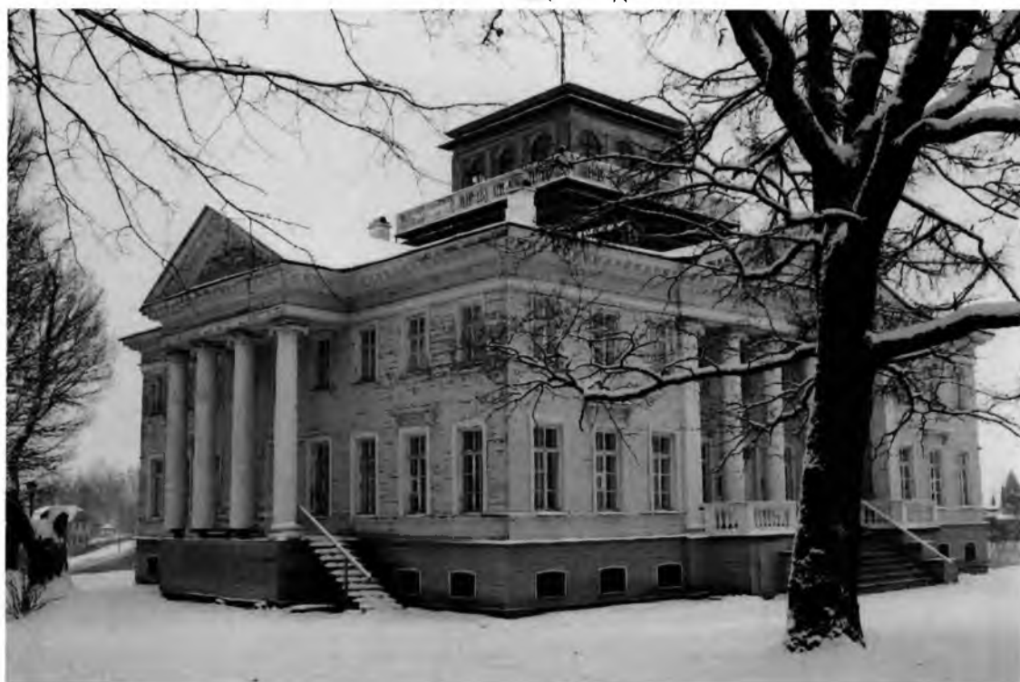
Фото 2. Общий вид (ю-в и ю-з фасады)