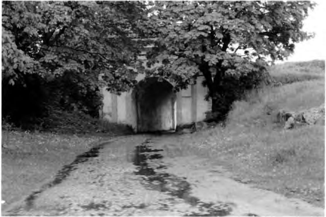
Рис. 2. Рavelинные ворота