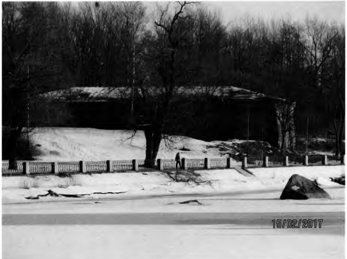
Рис. 14. Здание Инженерного дома