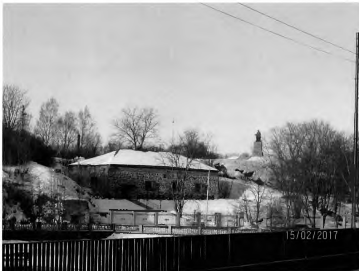
Рис. 12-13. Пороховой погреб на Петровской наб. дом 2