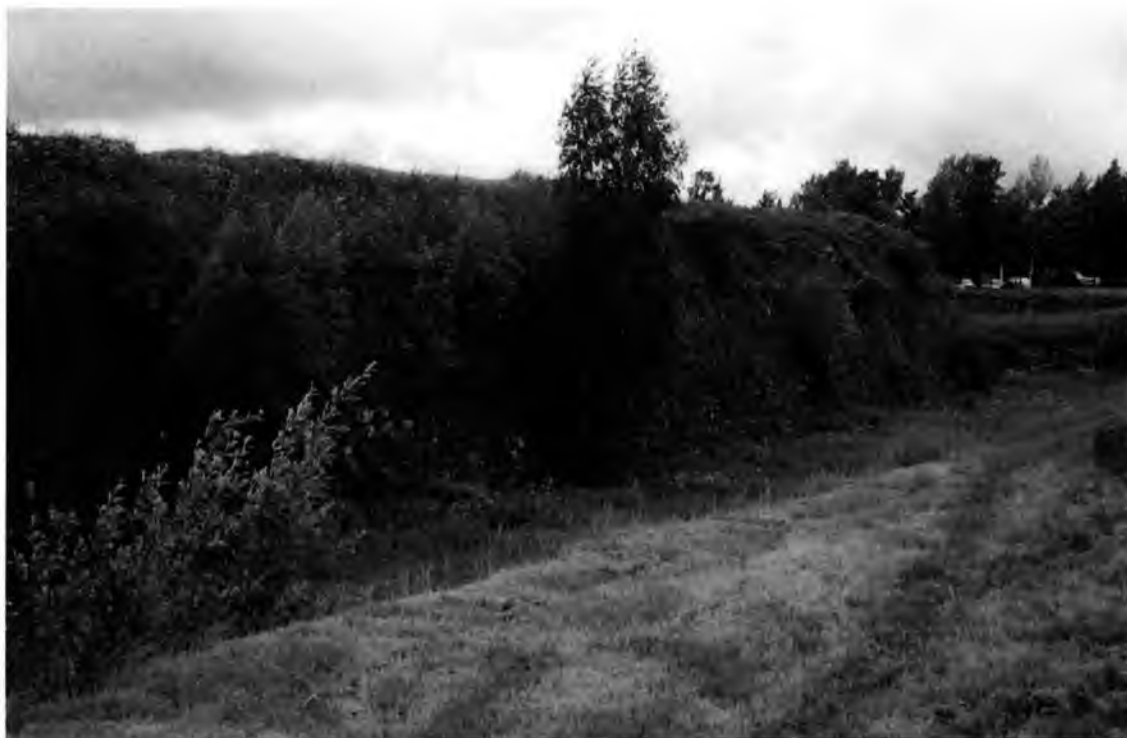
Рис.6. Вид на укрепления.