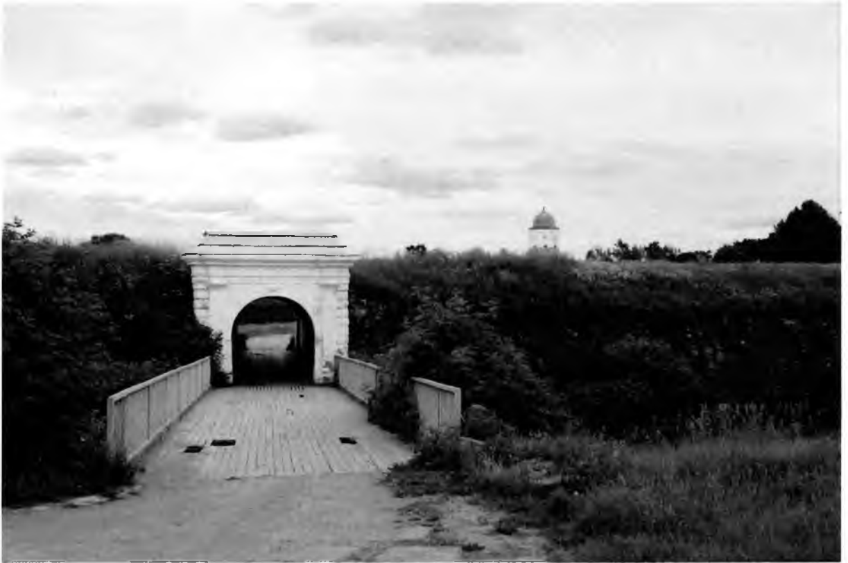
Рис. 8. 1-ые Фридрихсгамские ворота