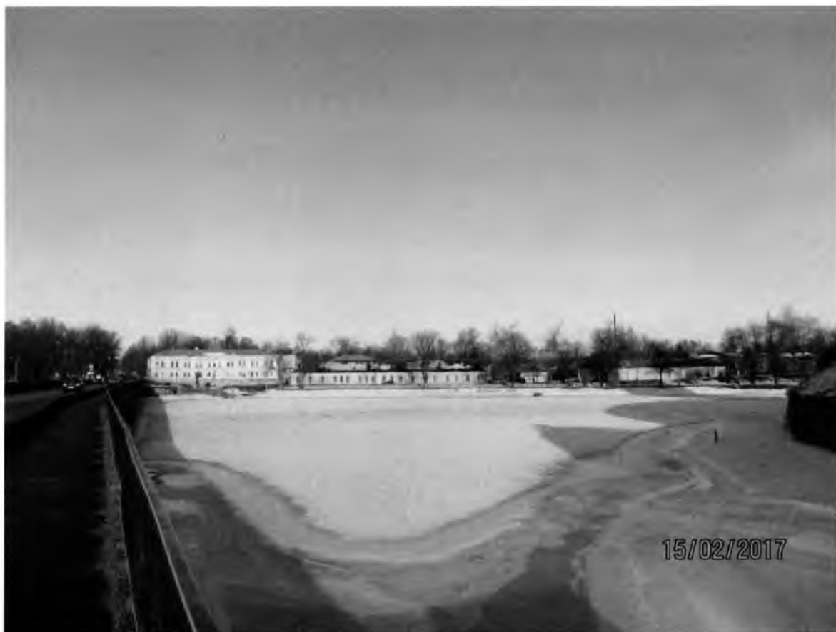
Рис. 10. Здание областного архива