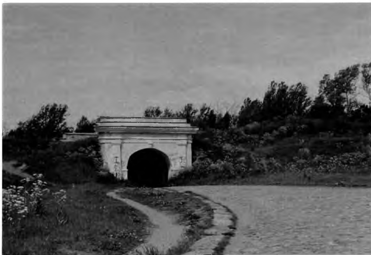
Рис.4. Вид на укрепления.