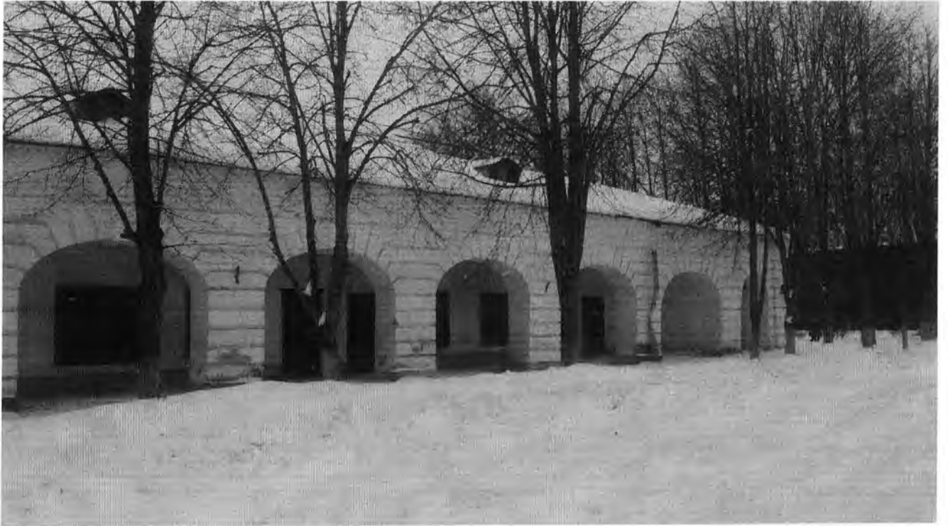
Фото 5 (январь 2017 г.)