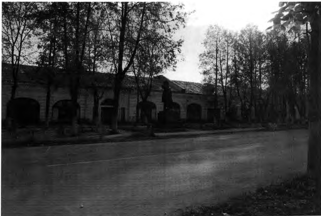
Фото 1. Общий вид, расположенный по адресу: Ленинградская область, Волховский муниципальный район, муниципальное образование Новолодожское городское поселение, г. Новая Ладога, проспект Карла Маркса, д. 29 (сентябрь 2016 г.)