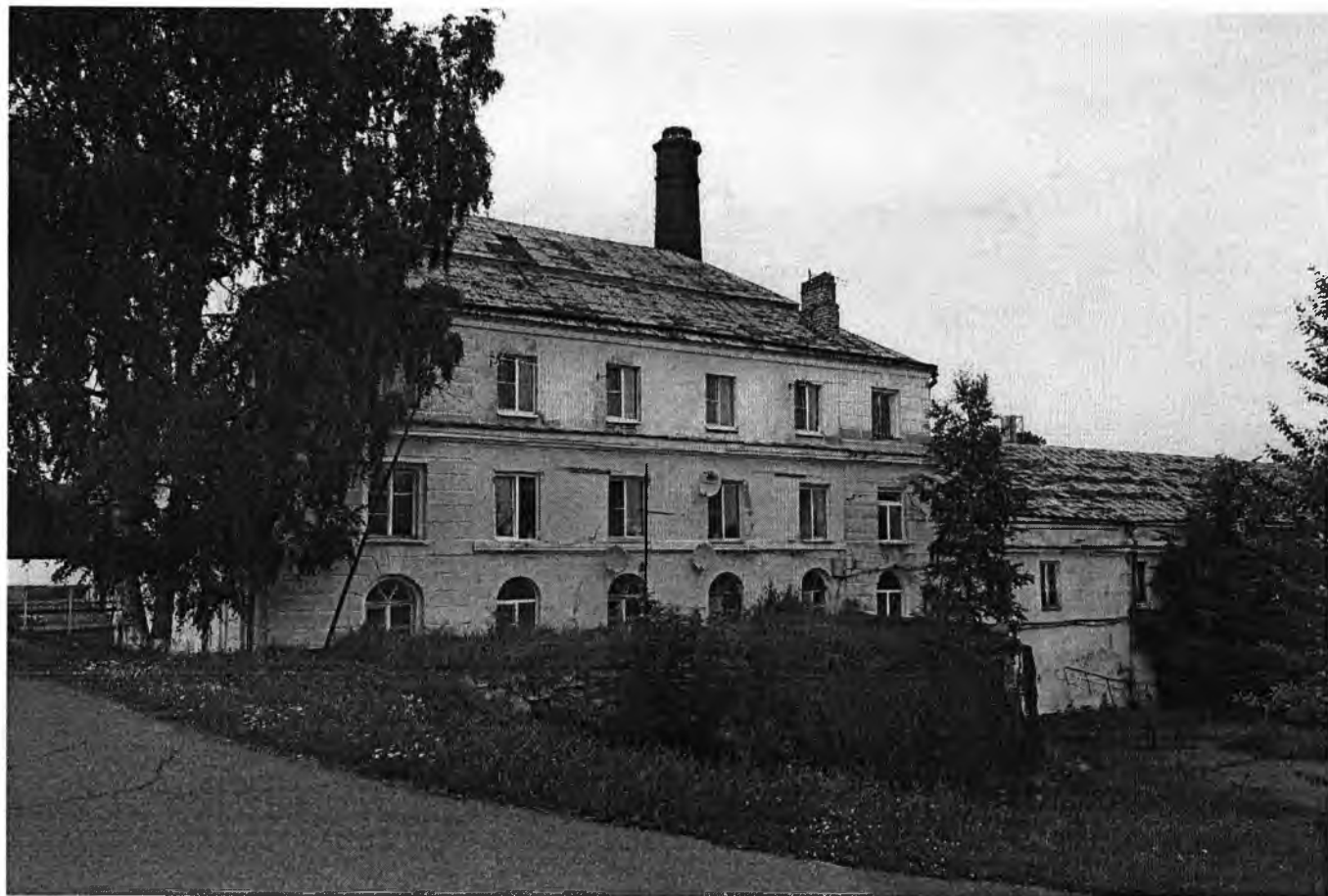
Фото 2 Юго-восточный фасад Дата съемки 29.07.2017