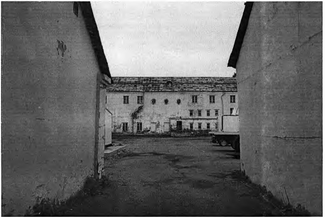
Фото 4 . Северо-восточный фасад. Вид во внутренний двор. Дата съемки: 29.07.2017