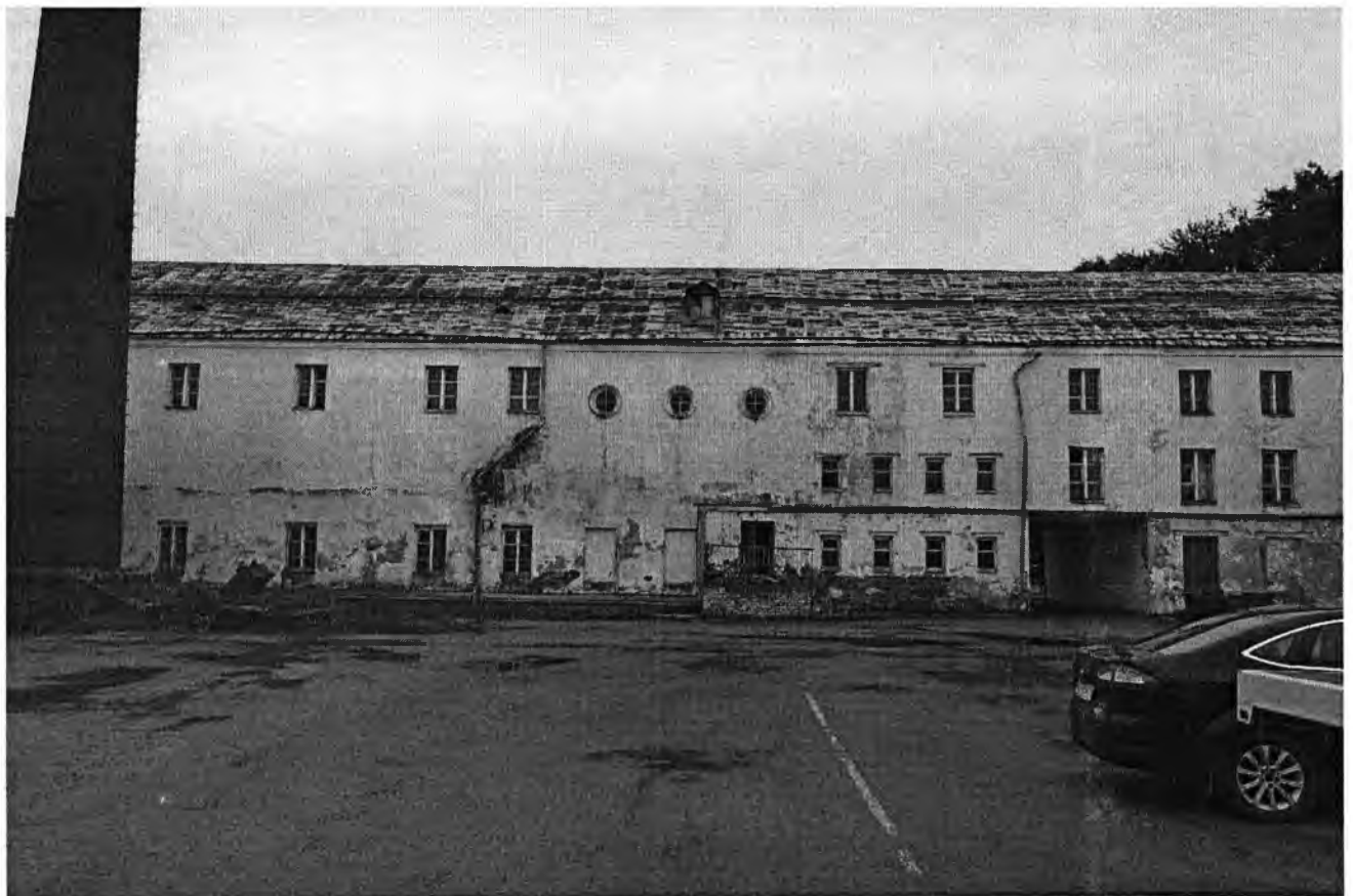
Фото 5. Внутренний двор. Дата съемки 29.07.2017