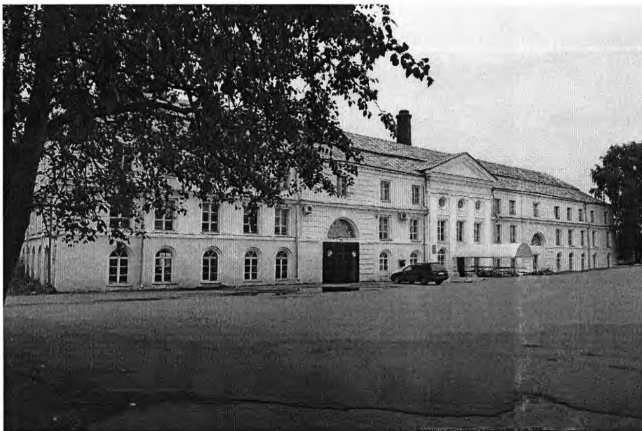
Фото 1. Юго-западный (главный) фасад. Дата съемки 29.07.2017