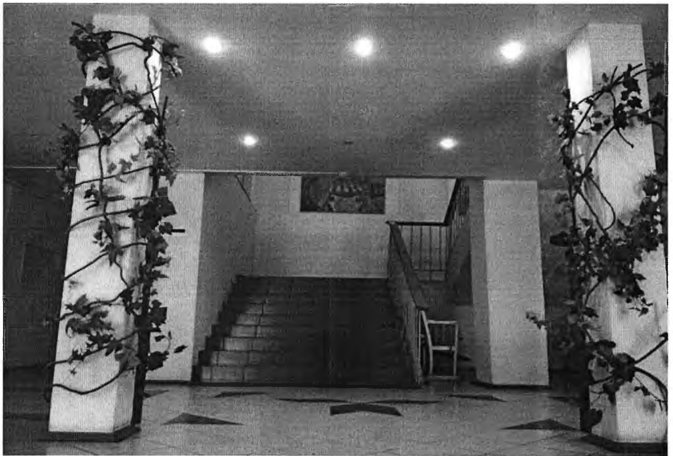
Фото 6 Интерьер. Дата съемки 23.01.2017