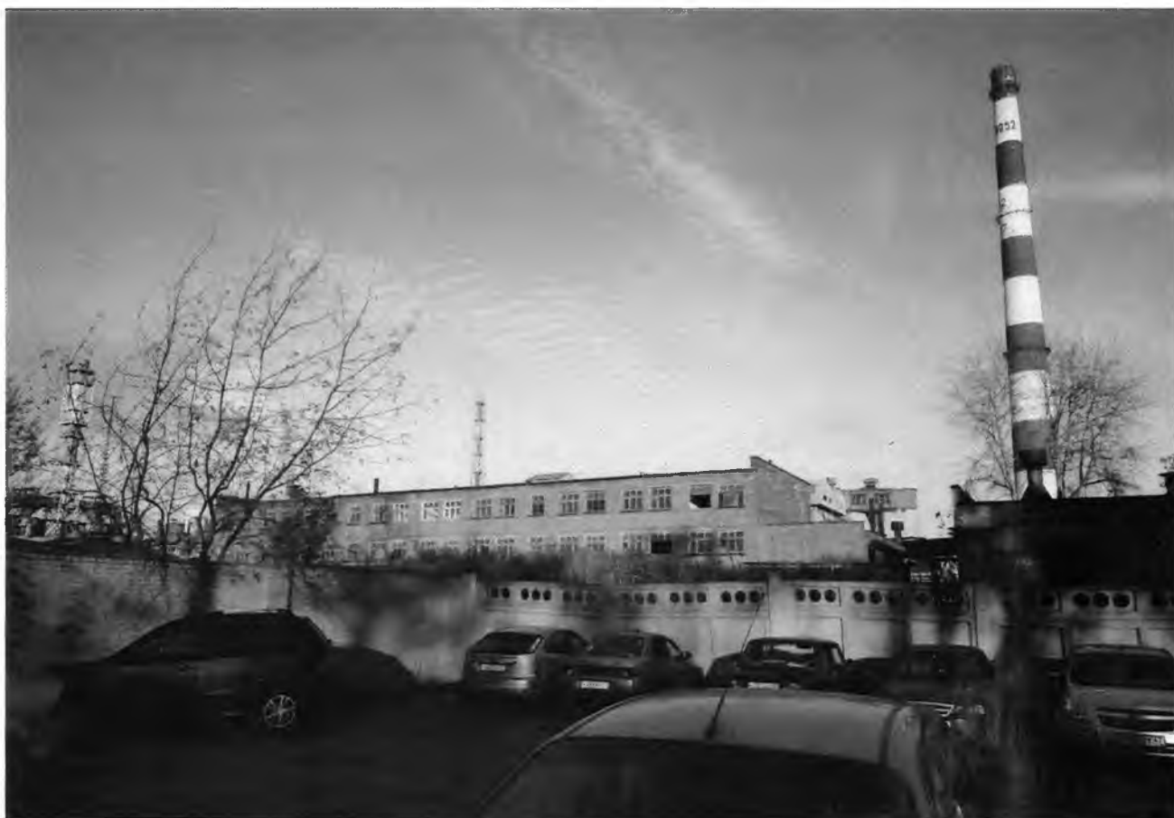
Фото 1. Общий вид, расположенный по адресу: Ленинградская область, Волховский муниципальный район, г. Волхов, Кировский пр., 20