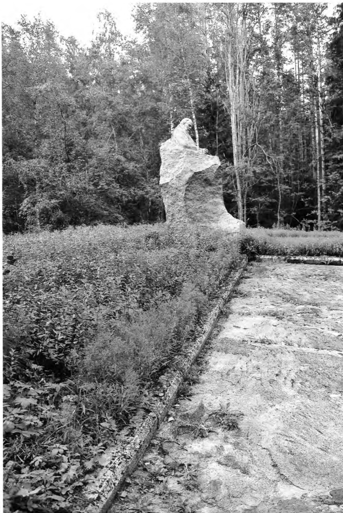
Фото 1. Общий вид объекта культурного наследия с западной стороны