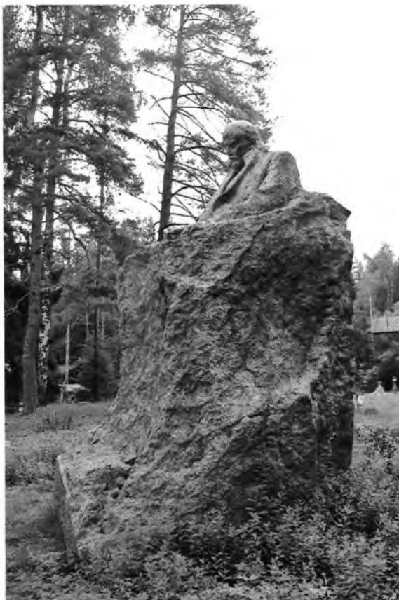
Фото 4. Общий вид объекта культурного наследия с северной стороны