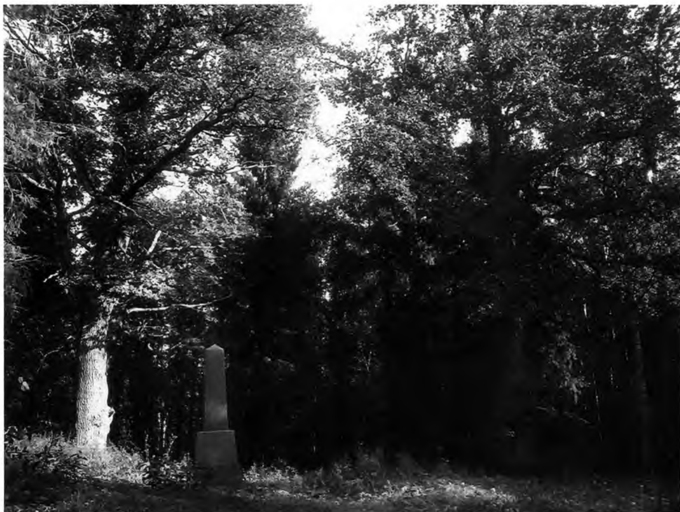
Фото 1. «Обелиск, установленный на месте, где в XVIII в. находилась стекольная фабрика и лаборатория Ломоносова Михаила Васильевича»