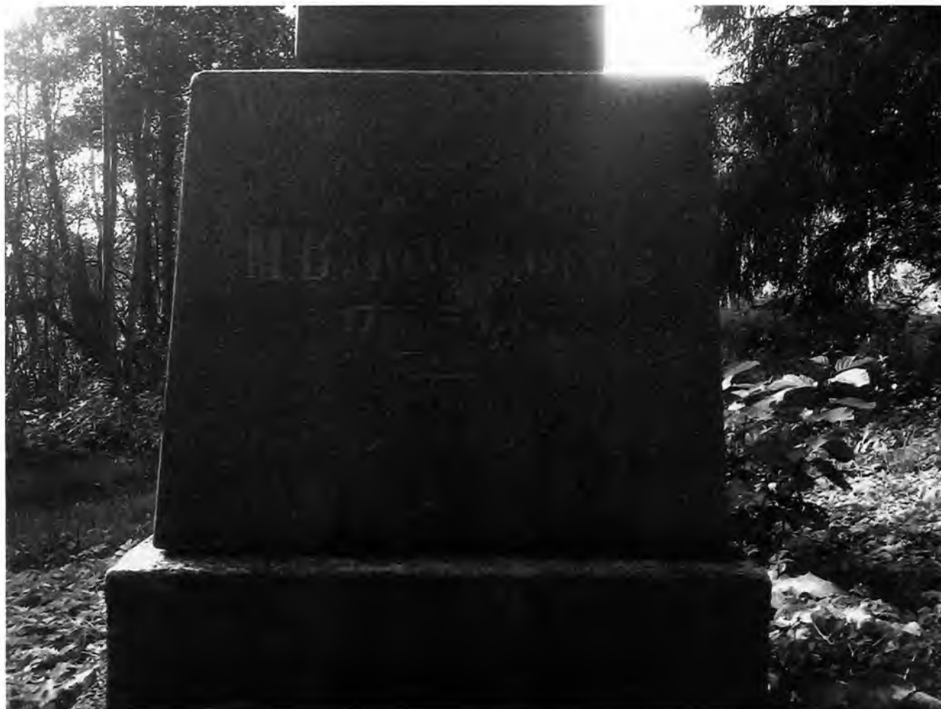
Фото 2. «Обелиск, установленный на месте, где в XVIII в. находилась стекольная фабрика и лаборатория Ломоносова Михаила Васильевича»